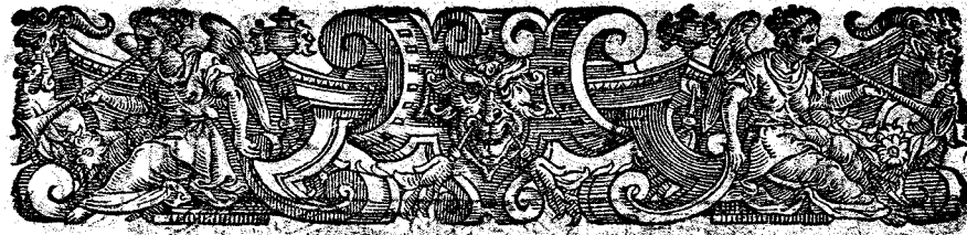
TAVOLA DELLE REGOLE D A B A L L A R E.